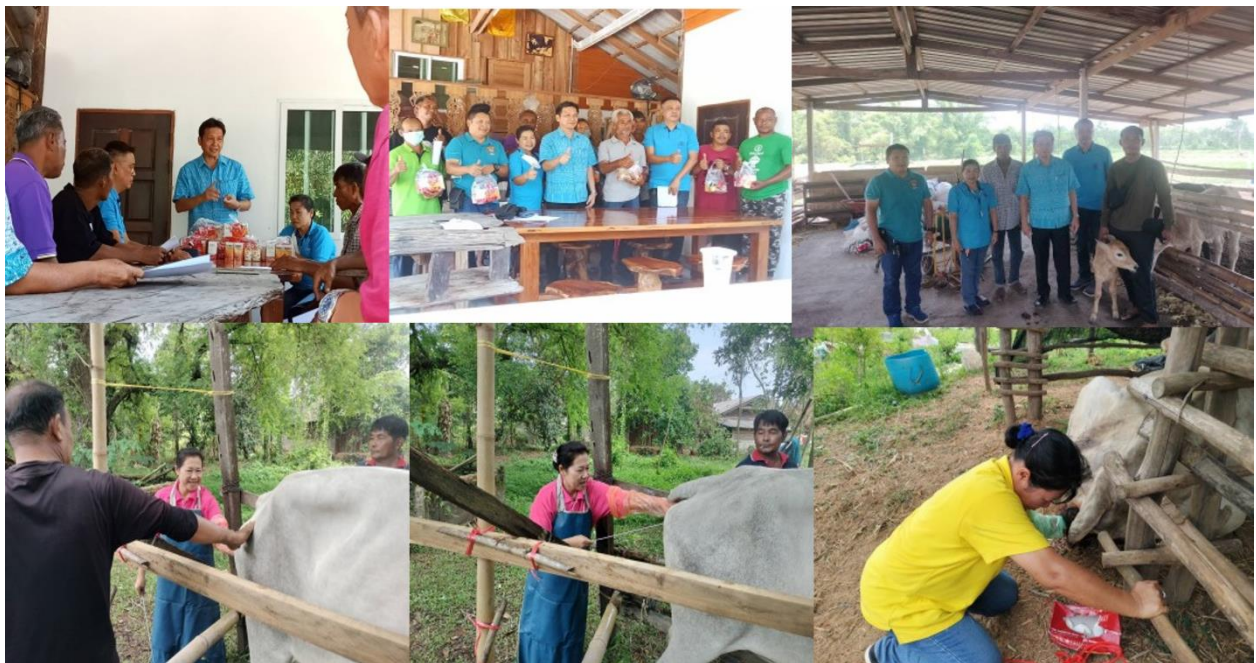
มติที่ประชุม รับทราบ