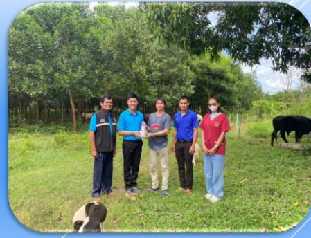
วันที่ 27 ตุลาคม 2566 ตรวจสอบ จักรกริชฟาร์ม ณ อำเภอกำแพงแสน