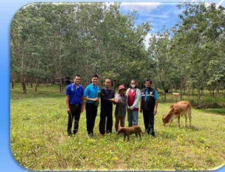
วันที่ 27 ตุลาคม 2566 ตรวจสอบ พิรุฬห์ฟาร์ม ณ อำเภอกำแพงแสน