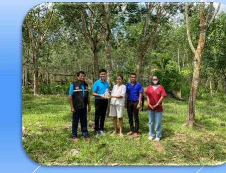
วันที่ 27 ตุลาคม 2566 ตรวจสอบ ปราณีฟาร์ม ณ อำเภอกำแพงแสน