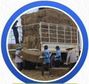
ขนส่งพร้อม