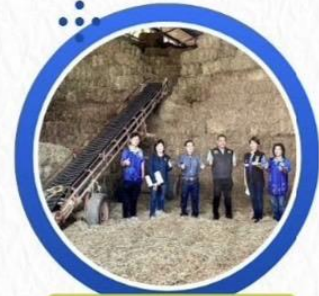
เสบียงพร้อม