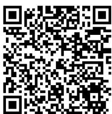
หนังสือฉบับเต็ม

ด้วย กองส่งเสริมและพัฒนาการปศุสัตว์ ได้ดำเนินการสอบถาม "ความพึงพอใจของเกษตรกรที่ได้รับการช่วยเหลือเยียวยาสัตว์ป่วยตายจากโรคล้มปี่ สกน" ในครั้งนี้ เพื่อเป็นประโยชน์ต่อการให้ความช่วยเหลือเยียวยาเกษตรกรที่ได้รับผลกระทบจากภัยพิบัติกรณีโรคระบาดสัตว์ จึงขอความอนุเคราะห์ สอบถาม และเก็บข้อมูลการวิจัยจากเกษตรกรที่ได้รับผลกระทบสัตว์ป่วยตายจากโรคล้มปี่ สกน อย่างน้อยจังหวัดละ ๕๐ ราย ยกเว้นจังหวัดที่เกษตรกรได้รับผลกระทบสัตว์ป่วยตายจากโรคล้มปี่ สกน น้อยกว่า ๕๐ ราย ขอความกรุณาตอบแบบสอบถามทุกราย โดยสามารถตอบแบบสอบถามได้จาก google form ตาม QR Code หรือตามแบบสอบถามที่แนบมาพร้อมนี้ ทางใดทางหนึ่ง ภายใน ๓๐ ธันวาคม ๒๕๖๕ หากตอบเป็นเอกสารรวบรวมส่งรวบรวมเอกสารและส่งกลับกองส่งเสริมและพัฒนาการปศุสัตว์ ภายในวันที่ ๖ มกราคม ๒๕๖๖