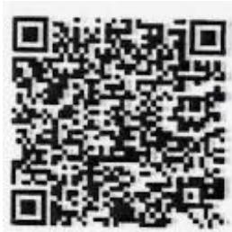
แบบสอบถาม