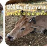
มีไข้ ซึม เบื่ออาหาร อารมณ์เสีย น้ำตาไหล