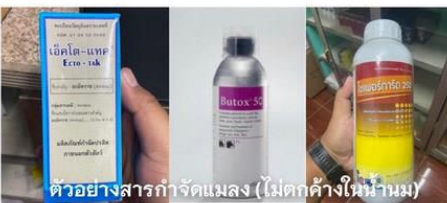
ตัวอย่างสารกำจัดแมลง (ไม่ตกค้างในน้ำนม)

ฟาร์มโคนมที่เกิดโรค อาจไม่จำเป็นต้องหยุดส่งนม ควรปฏิบัติตามมาตรการของแต่ละพื้นที่ งดนำเข้าโคจากพื้นที่เสี่ยง!!