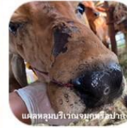
แสดงตุ่มบริเวณจมูกปาก