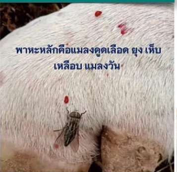
พาหะหลักคือแมลงดูดเลือด ยุง เห็บ เหลือบ แมลงวัน

น้ำลาย สารคัดหลั่งต่างๆ สะเก็ดแผล สามารถเป็นตัวแพร่เชื้อได้ แต่ไม่ใช่ทางติดต่อหลัก