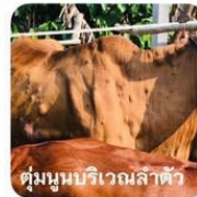
ตุ่มนูนบริเวณลำตัว