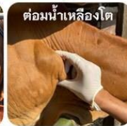
ต่อมน้ำเหลืองโต