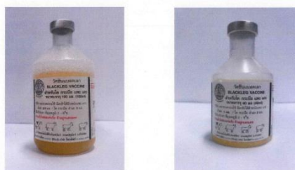
บรรจุภัณฑ์เดิม ขนาด 100 มล./ขวด 5 มล./โดส (โค-กระบือ) 2.5 มล./โดส (แกะ แกะ)