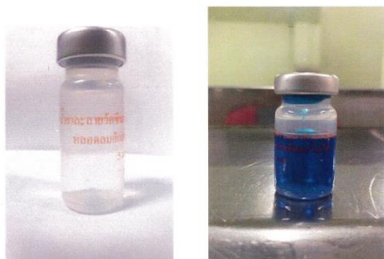
น้ำยาละลายแบบเดิม (ใสไม่มีสี)